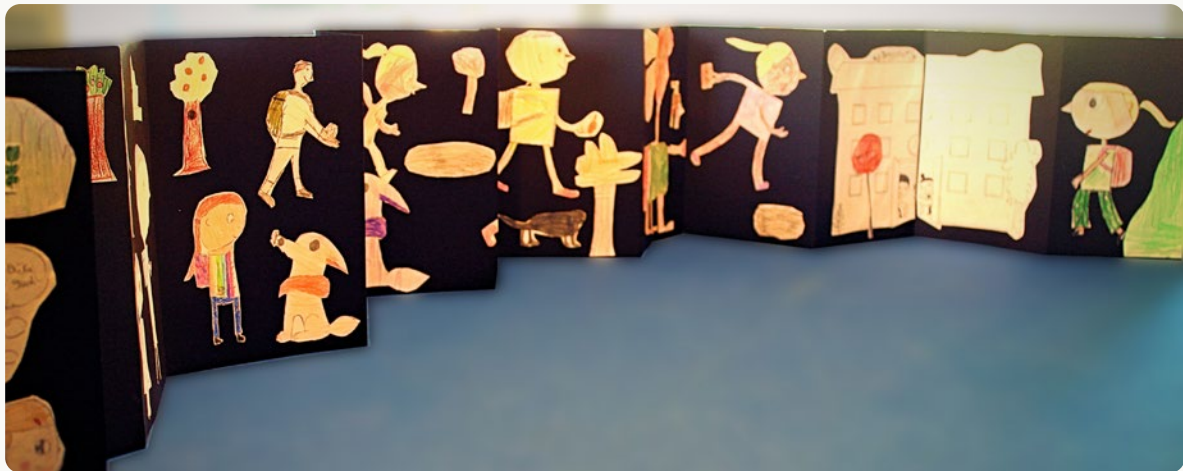
Eks. foldebog af 2.A, Kirstinedalsskolen i Køge

Aktivitet til indskolingen, 2 lektioner (og evt. noget tid til færdiggørelse)